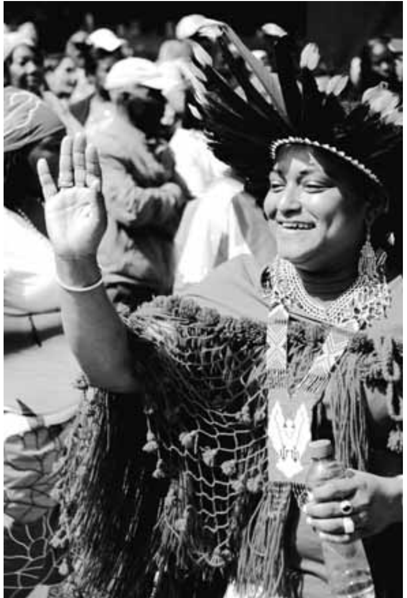
Tekst: Jan Schaake.