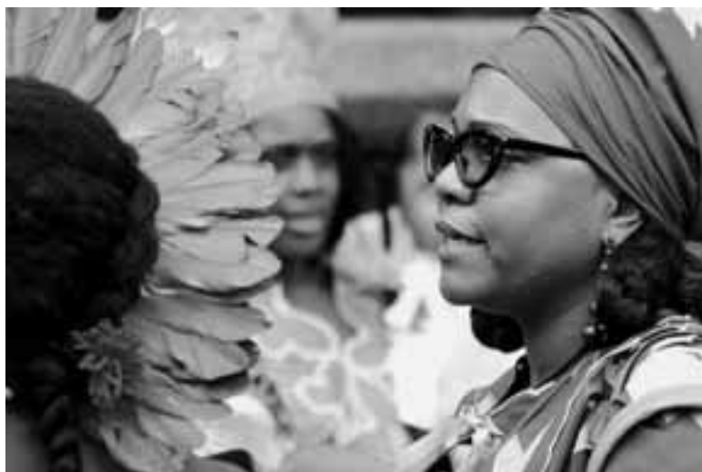
LANDELIJKE SLAVERNIJHERDENKING 2011