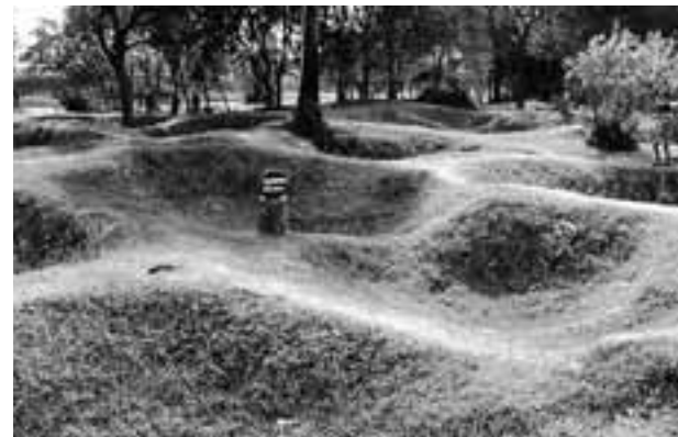
MASSAGRAF IN CHOEUING EK, DE ZGN KILLING FIELDS. HIER ZIJN MEER DAN 9000 LICHAMEN GEVONDEN. VOORNAMELIJK VOORMALIGE GEVANGENEN VAN DE TUOL SLENG GEVANGENIS.

Over de zin van tribunalen wordt verschillend gedacht. De een noemt het historische belang: de geschiedschrijving en de collectieve verwerking is uiterst belangrijk, de ander maant tot voorzichtigheid bij de speurtocht naar de waarheid, bewijsmateriaal is niet altijd te vinden, en als dit onverhoeds tot vrijspraak leidt kan dit meer trauma's veroorzaken. Van andere tribunalen leert men. Processen wekken vaak enorme verwachtingen en richten zich veelal alleen tegen het individu, terwijl het brede perspectief, de samenhang, het waarom, minstens zo belangrijk zijn.