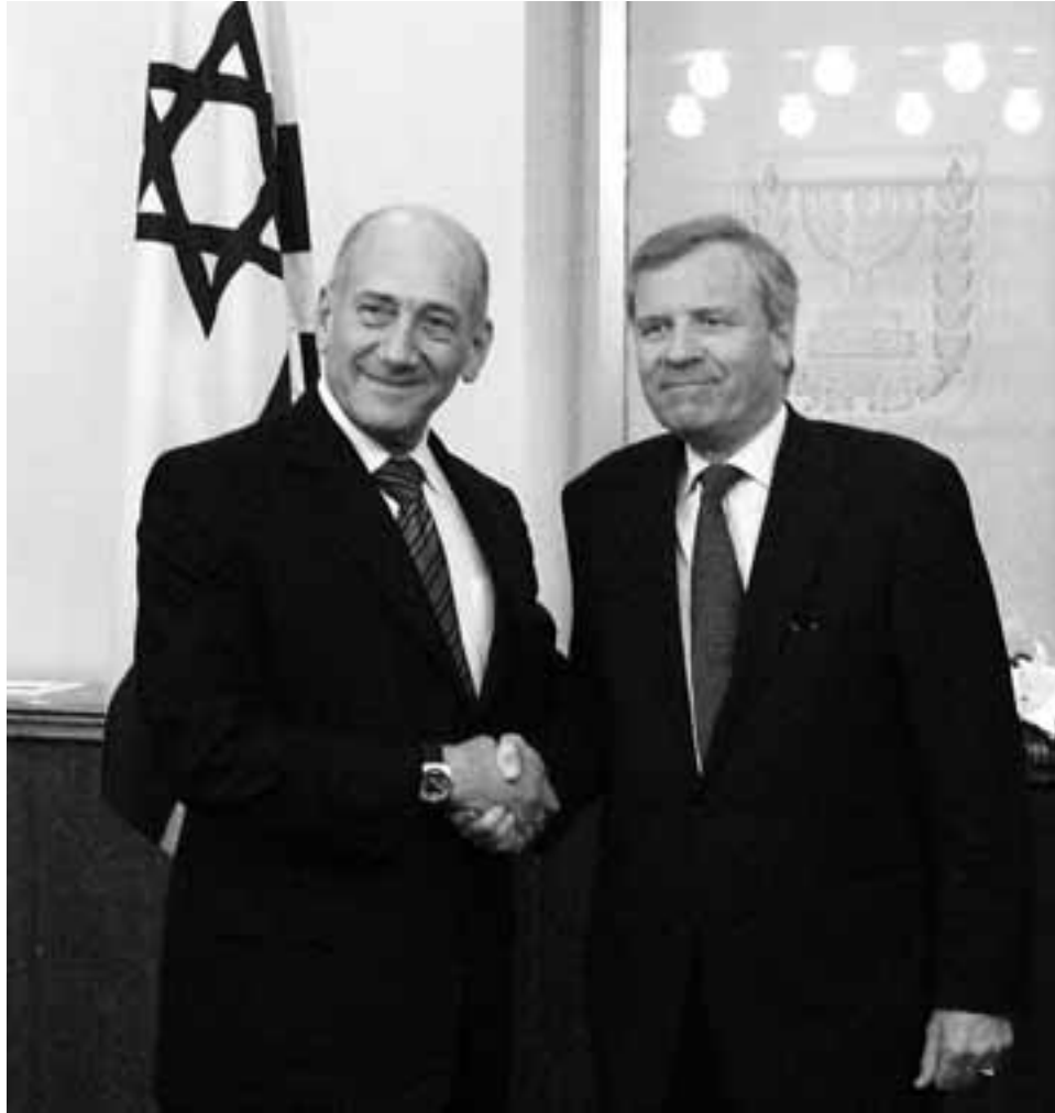
11 JANUARI 2009. SECRETARIS-GENERAAL VAN DE NAVO JAAP DE HOOP SCHEFFER OP BEZOEK BIJ EERSTE MINISTER VAN ISRAËL EHUD OLMERT

De speciale positie van Israël blijkt onder meer uit het feit dat het in 2006 – vlak na de oorlog met Libanon – als eerste land een Individueel Samenwerkingsprogramma met de NAVO overeen kwam, waarmee een permanente strategische dialoog werd gestart over onder meer terrorisme, het delen van informatie van de inlichtingendiensten, nucleaire proliferatie, wapenaankopen en logistiek. Daarmee kreeg Israël toegang tot het