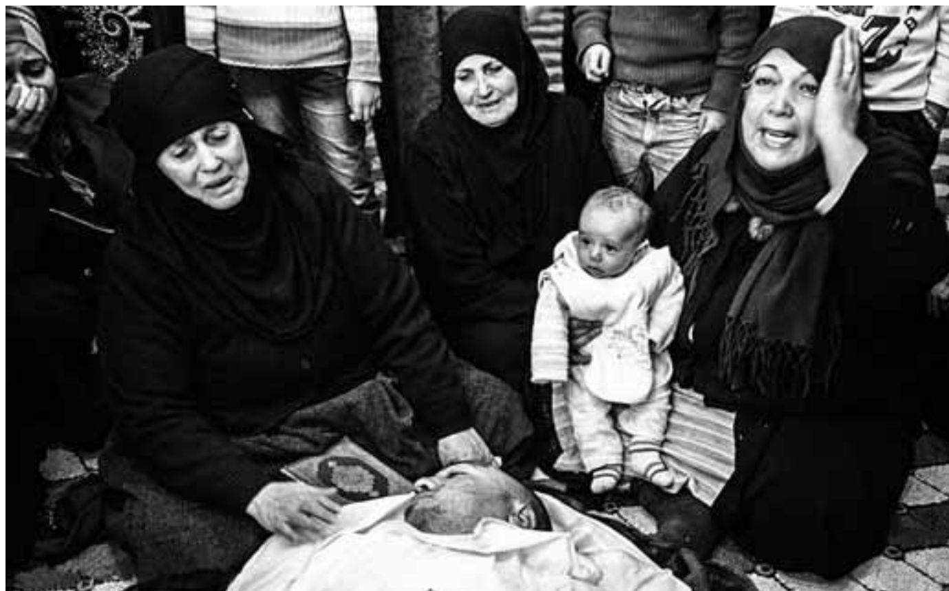
Qusayn, vlakbij Homs. Syrische vrouwen rouwen bij familielid

ficiële vertegenwoordiger van het Syrische volk. Dat alles doet heel erg denken aan Libië. Een corridor moet immers militair verdedigd worden. Bovendien kan die gebruikt worden als een uitvalsbasis voor de gewapende oppositie, het zogenaamde Vrije Syrische Leger, dat in werkelijkheid meer een los verband is van gewapende lokale milities. In de VS lanceerden diverse senatoren een oproep om deze oppositie te bewapenen. Volgens de Israëlische website Debkafile, gespecialiseerd in militaire inlichtingen, waren er al Britse en Qatarese Special Forces in de Syrische stad Homs actief toen daar hevige gevechten plaatsvonden. Ze zouden weliswaar niet rechtstreeks aan de gevechten tegen het Syri-