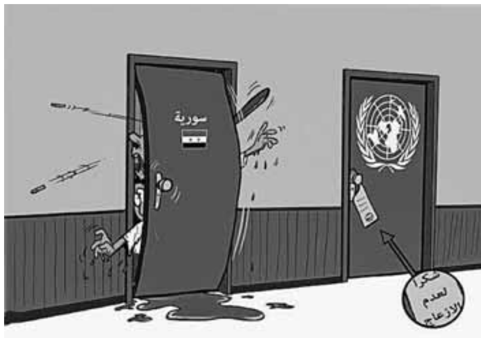
VN tegen Syriërs: niet storen

Vorige maand reisde ik in het land rond met een gewoon toeristenvisum en kon er met heel wat Syriërs spreken. Wat