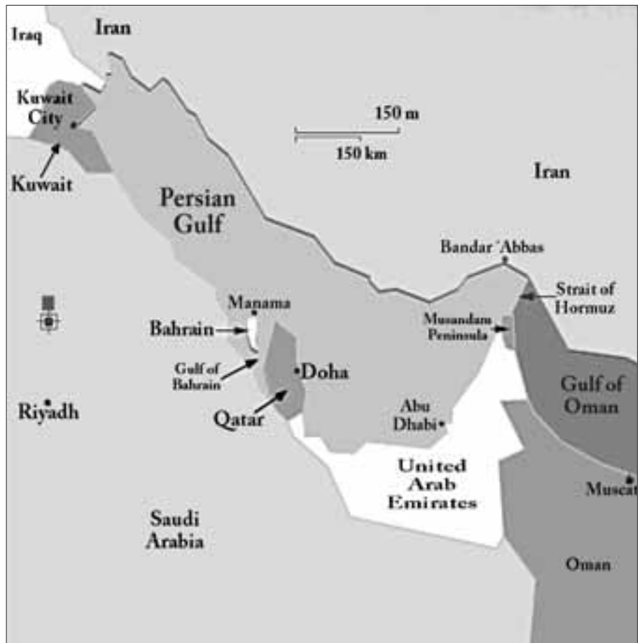
Straat van Hormoez

Het resultaat van een Israëlische lucht-aanval op de nucleaire installaties wordt veelal als beperkt beoordeeld, vanwege de lange afstand, de daardoor 'geringe'