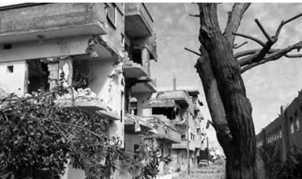
BABA AMIR (SYRIË)

En zo bleef het decennia lang relatief rustig. Een rust gebaseerd op angst. Angst voor het regime zelf en nog grotere angst voor twee kwaden die nog erger leken: de moslimfundamentalisten en Israël. Door middel van een tot in het absurde doorgevoerde manipulatie van de informatie, vanaf de schoolboekjes in de eerste klas tot en met de kranten slaagde het regime erin om het schrikbeeld van deze vijanden tot satanische proporties te vergroten. Twee generaties kregen deze angst met de papepel ingegoten. Zo wordt Assad in Syrië gevreesd door zijn vijanden, maar zeker ook door zijn 'vrienden'. Alleen zijn die vrienden, de minderheden waarop het regime vanouds steunt, nóg bang voor wat er ná hem zal komen. En ook bij de soennitische meerderheid leeft die angst, de meesten van hen prefererden daarom ook de status quo, althans tot voor kort. Dat is de voornaamste reden dat het Syrische volk zo lang de adem heeft ingehouden alvorens de straat op te gaan