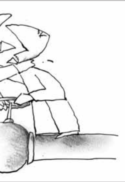
Tekening: Len Munnik

In Nederlandse wapenexporten is de link met de aanwezigheid van olie in de ontvangende landen ook regelmatig te leggen. Soms ligt dit wel heel dicht aan de oppervlakte: in 2009 kreeg scheepsbouwer TP Marine zonder problemen een vergunning voor een controversiële levering van catamarans voor troepenvervoer aan Nigeria, ondanks het slepende gewapende conflict in de Nigerdelta en de mensenrechtenschendingen door politie (para)militairen die in dat kader aan de orde van de dag zijn. De Nederlandse regering verdedigde deze levering, die overduidelijk in strijd is met de geldende EU-wapenexportregels, met een expliciete verwijzing naar de bescherming van olieplatforms van onder meer Shell in de regio. De band tussen TP Marine en de Nigeriaanse marine is steeds inniger geworden: vorig jaar werd de bouw van een gezamenlijke werf in de haven van Lagos aangekondigd. Met deze faciliterende rol geeft TP Marine de marine een vrijbrief haar werf te gebruiken om de interne repressie in het belang van de heersende elite en de grote oliebedrijven nog verder op te voeren.