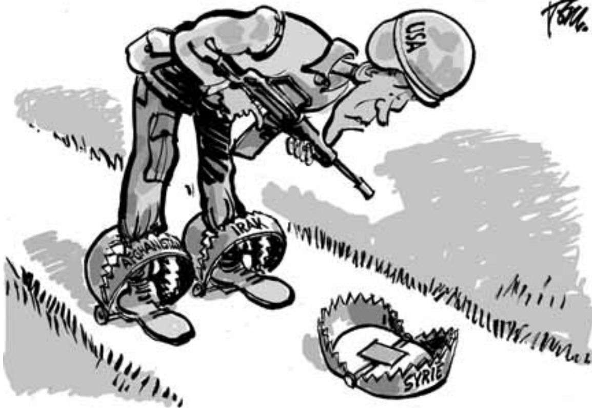
Tekening: Tom Janssen / Dagblad Trouw