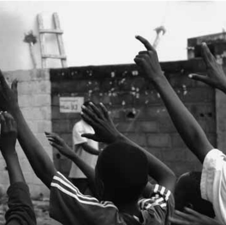
OEFENING FLINTLOCK. BAMAKO, MALI 2007

in de hoofdstad. “De extremisten willen nog steeds Mali overnemen,” verzekert hij. Hij is hoofd van de landelijke Organisatie van Jonge Moslims. “De wahabieten en de salafisten zijn handlangers van de terroristen.” En wijst op de trainingscentra bij de wahabitische moskeeën in Bamako. “Die doen aan ideologische manipulatie. Ze houden er een soort militie op na. Ze manipuleren met hun ophitsende taal ongeschoolde en werkloze jongeren en werken aan de expansie van de Arabische invloed in Afrika. In de Arabische wereld wordt nog steeds gedacht dat Afrikaanse moslims geen echte moslims zijn.”