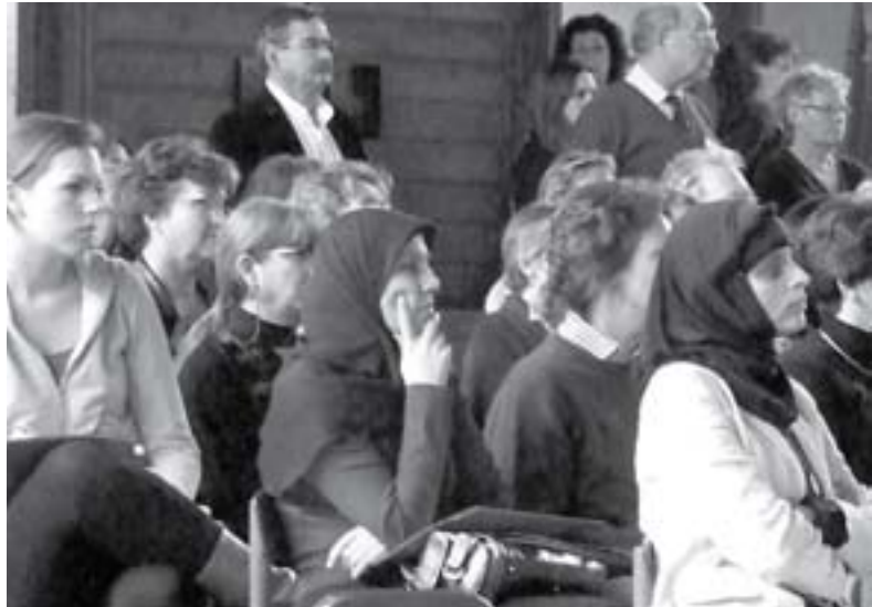
8 maart Wilhelminakerk Utrecht