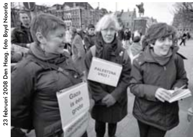
23 februari 2008 Den Haag, foto Boyd Noorda

Zo'n 200 mensen waren zaterdag 23 februari aanwezig op de manifestatie Gaza open, muren slopen op het Buitenhof, die georganiseerd was door het Palestina Komitee, de Palestijnse Gemeenschap Nederland en I.S. In ongeveer dertig steden in de wereld vonden op dezelfde dag manifestaties plaats om aandacht te vestigen op het Israëliëse beleg van het dichtbevolkte gebied. Bombardementen, voedseltekort en gebrek aan medicijnen hebben de afgelopen maanden aan honderden Palestijnen het leven gekost.