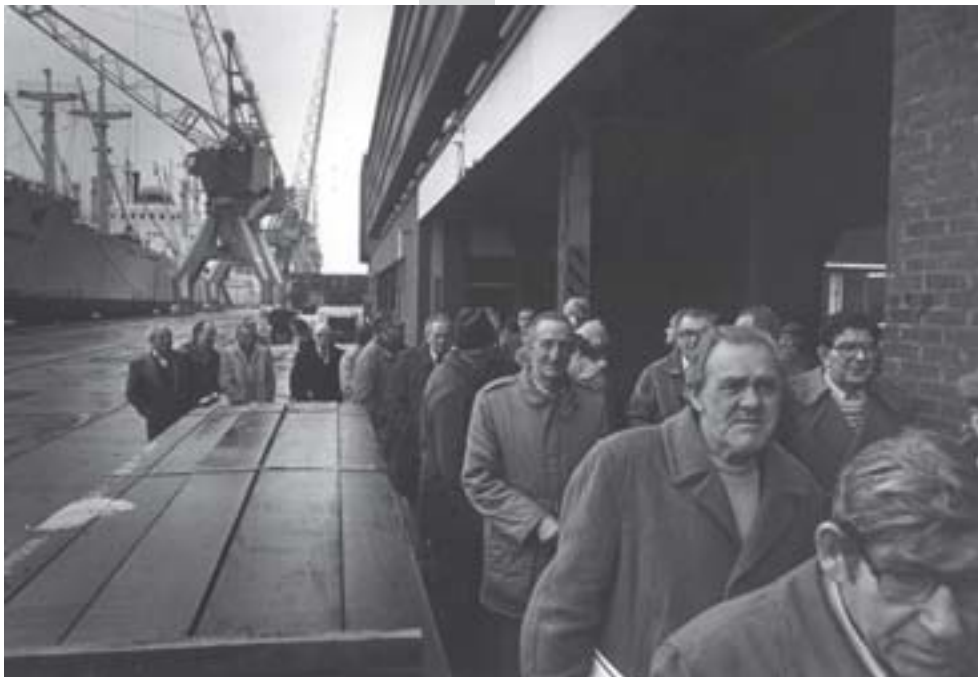
havenstaking Rotterdam 3 maart 1984.

In 2002 werd er door middel van het Europees Kaderbesluit aan alle lidstaten de bindende verplichting opgelegd om wettelijke anti-terreurmaatregelen te nemen. In Nederland zijn er de afgelopen jaren een aantal wetten en maatregelen tot stand gekomen om terrorisme te bestrijden. Een interview hierover met Astrid Essed. Zij is mensenrechtenactiviste en publiceert regelmatig over de controle van de overheid op de burger.