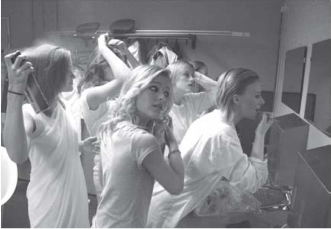
voorbereiding op de première.