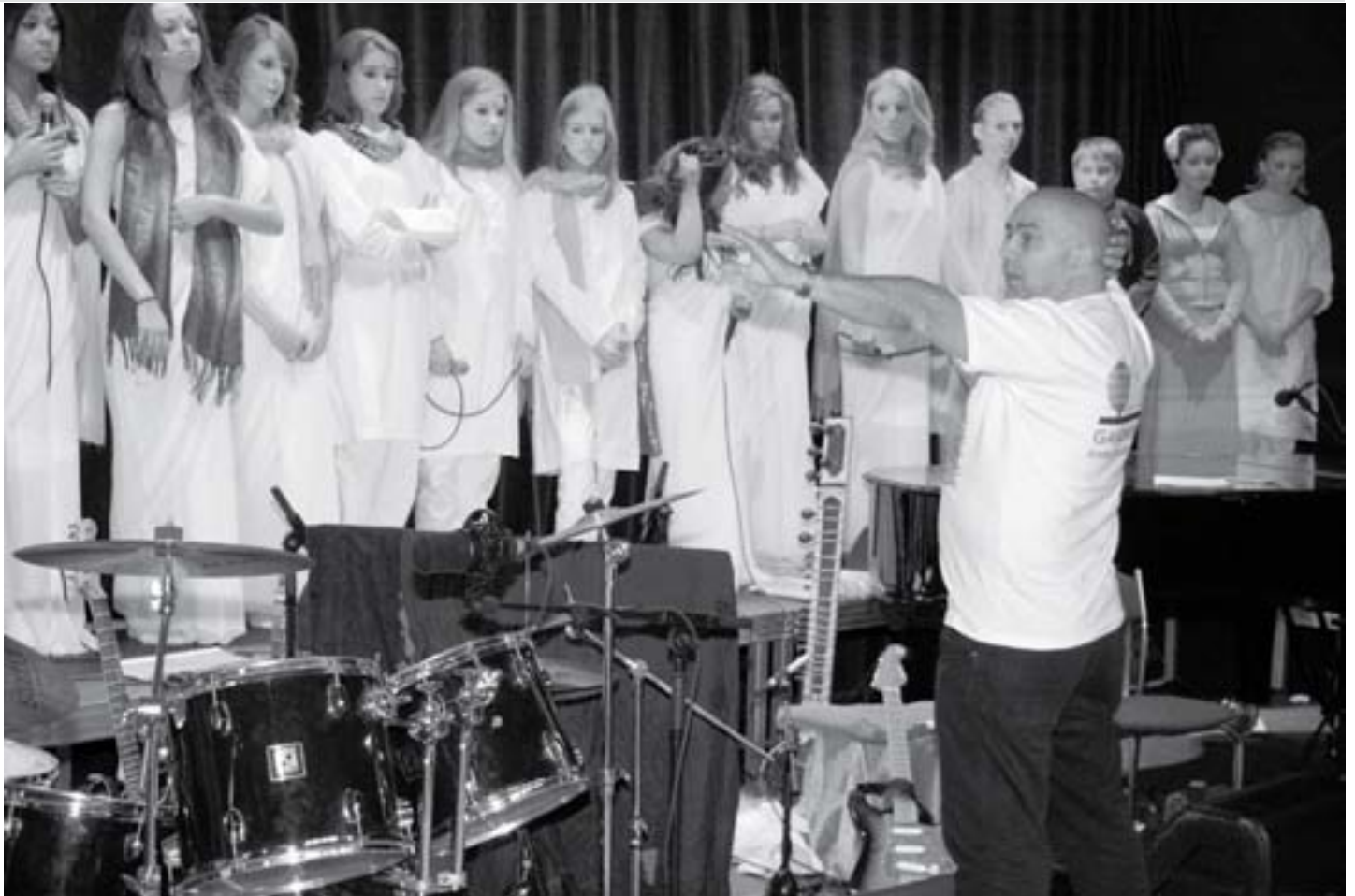
generale repetitie ghandimusical 31 januari 2008 Amstelveen.

Op 30 januari 2008 ging in Schouwburg Amstelveen een nieuwe Nederlandse musical in première: Gandhi. Het is dan precies zestig jaar geleden dat de 'vader van India' werd vermoord. De zelfgeschreven musical werd gespeeld door scholieren van het Amstelveen College. Een interview over een bijzonder project met de bedenkers en drie leerlingen die in de Gandhi musical meespeelden.