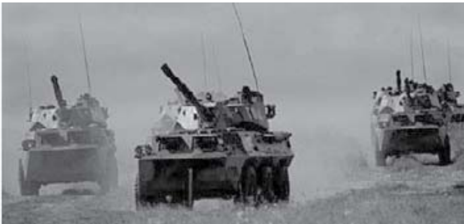
Pantseroefening tijdens SCO-oefening Peace Mission 2007

De Sjanghai Five was vooral opgericht om grensconflicten op te lossen en tegen de "drie kwaden" (terrorisme, extremisme en separatisme) op te treden om te voorkomen dat islamitische landsdelen, als Tsjetsjenië en Xinjiang zich met steun van Westerse geheime diensten zouden afsplitsen. Maar ook in Kazachstan, Kirgizië en Tadjikistan bedreigden religieus-politieke leiders de lokale autoriteiten van deze jonge landen die nog maar kort geleden waren afgesplitst van de Sovjet-Unie en zelfstandige staten geworden waren. Deze religieus-politieke bewegingen werden gesteund door Pakistan, Saoedi-Arabië en de Verenigde Staten. Zoals prof. Michel Chossudovski concludeerde: "de