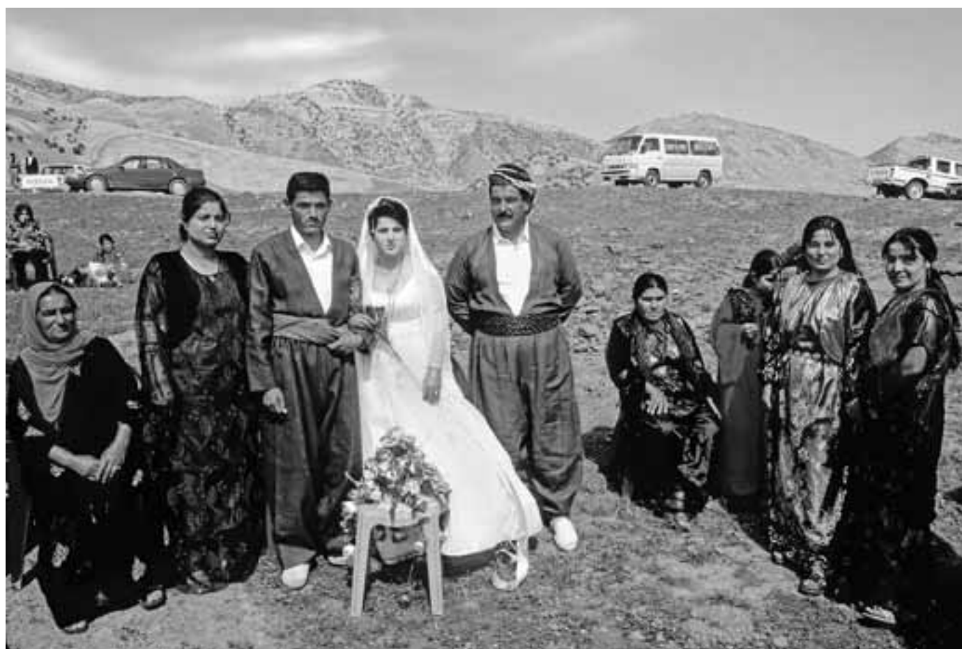
BRUILOFT IN OPEN LUCHT.