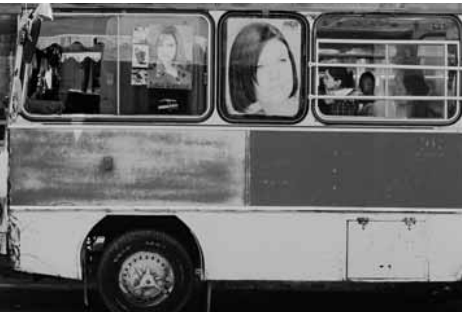
BUSSTATION IN ZAKHO