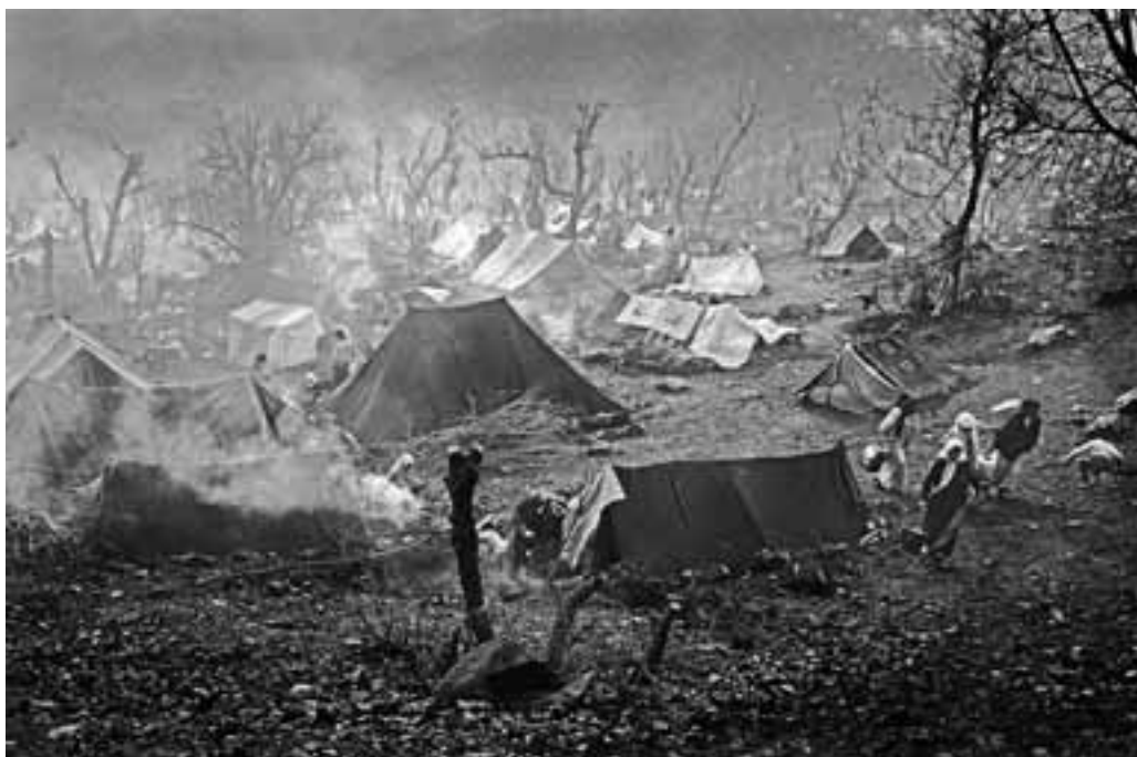
MAART 1991, IRAAKS KOERDISCHE VLUCHTELINGEN IN TURKIJE