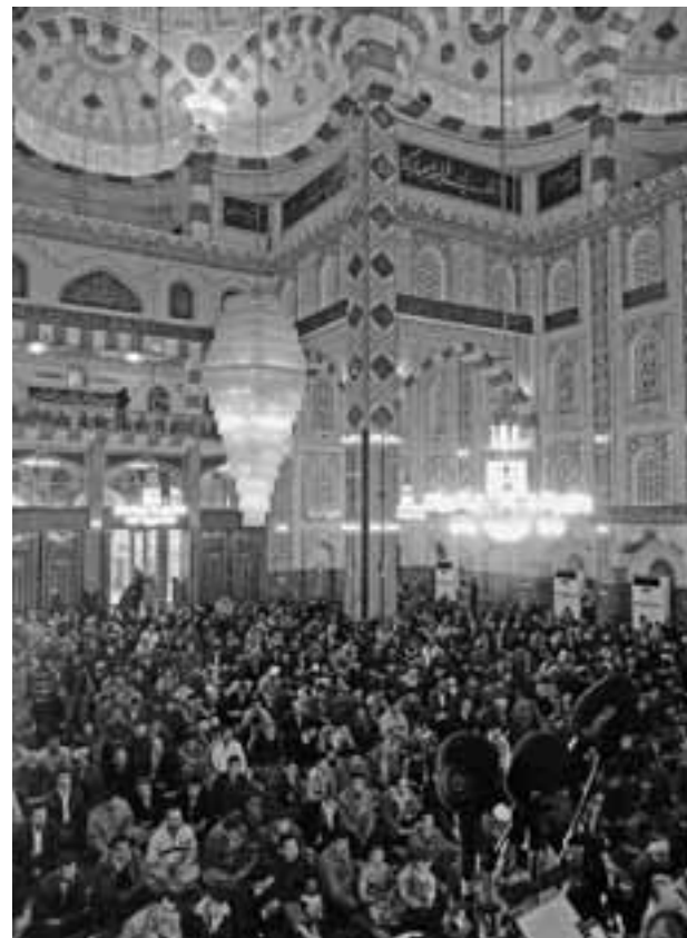
MOSKEE IN ERBIL