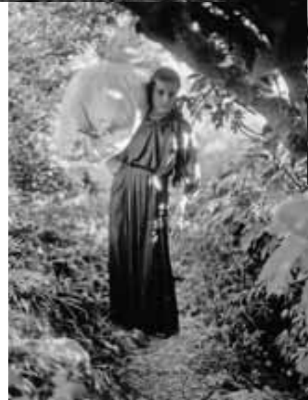
MEISJE IN BARSAN