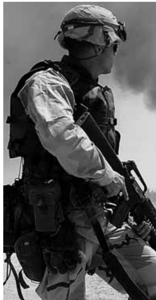
RUMAYLAH OLIEVELDEN IN ZUID IRAK

tarische politiek van premier Nouri al-Maliki, die recent nog verklaarde dat zijn belangrijkste identiteit 'sjiïet' is?