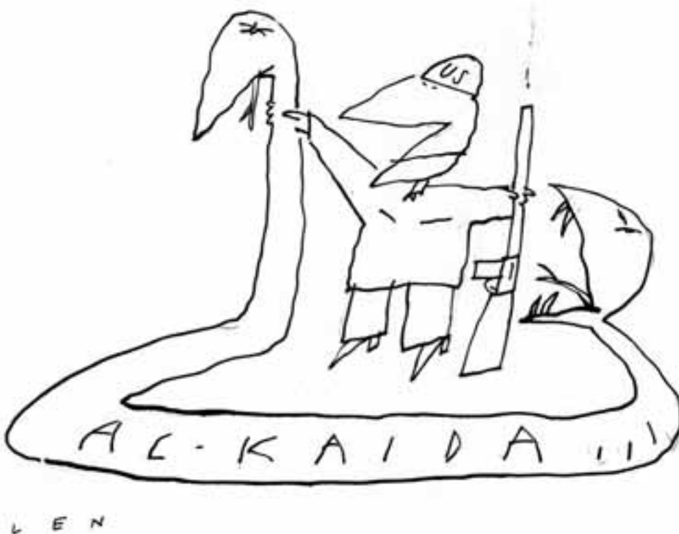
Tekening: Len Munnik