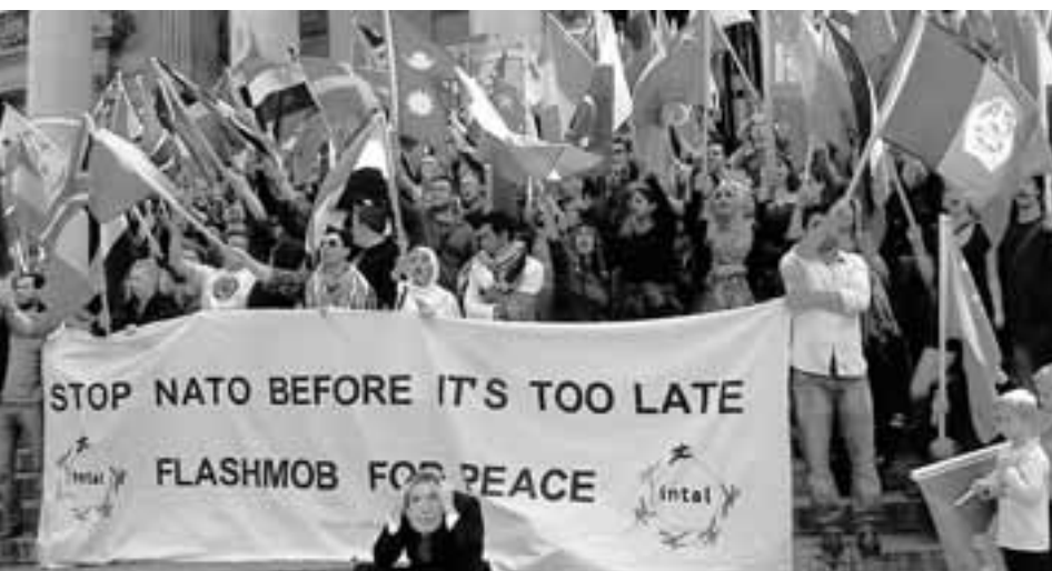
BIJ DE TRAPPEN VAN DE BEURS IN BRUSSEL ORGANISEERDE INTAL EEN FLASHMOB FOR PEACE (20 MEI).

Onder het oog van de pers trotseren honderden activisten de politie, die massaal aanwezig is. Het grootste deel wordt